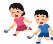
急げ急げ〜! ゴール目指して 走ります!