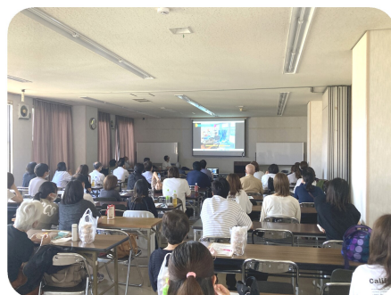
お楽しみ交流会で上映された福祉会DVD「えがお」の観賞