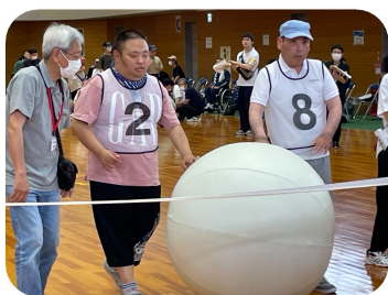
力を合わせてゴール!!