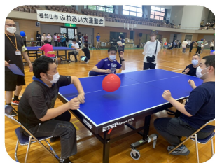
風船落とさないように〜!