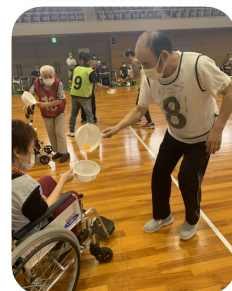
ザルからザルへ ボールをバトンです