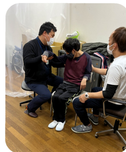
姿勢の確認! どうですか?

要性など基本的な内容や、悩み を出し合い意見交換をしました。 その際に「リハビリ訪問指導」 の提案があり、相談内容に基づ き、現在までに3名の仲間につ いての助言を頂いています。