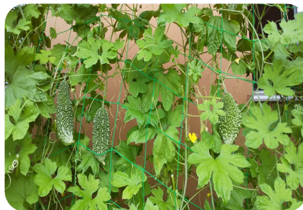
大きな実に育ちますように…

福知山高校三和分校で育てら れた苗をいただき、毎日の作業 の合間に水やりを忘れずに、育 てています。 まだまだ試作段階ですが、新 たな製品としてお届けできる日 が来るよう、今は、たくさん 実が大きくなり収穫を待つば かりです。 ただ、お茶にする前に「ゴー ヤチャンプルーにして食べたい」 という方がありますが!?