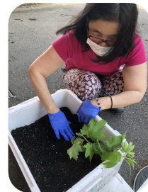
5月に苗を植えました

ゴーヤはビタミンや食物繊維 で検討を重ね『ゴーヤ 茶』にまとめました。 げなどの影響を受けな いもので、などの条件 材料はできるだけ値上 みなどで製造でき、原 環境にやさしく、体 は、新たな製品として ゴーヤ茶作りを始めま した。