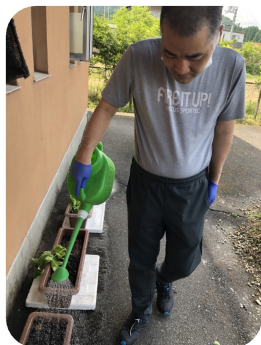
毎日の水やりは かかせません