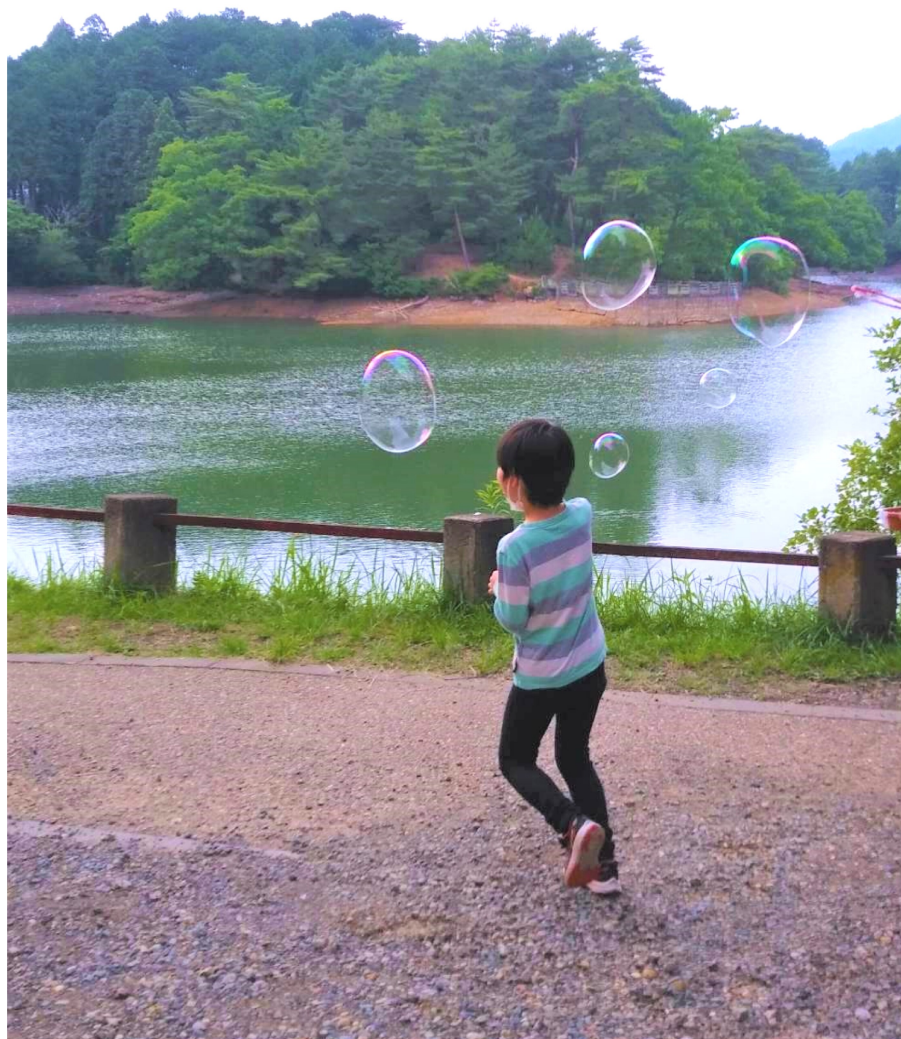
シャボン玉ほわほわ～

今日も学校頑張ったね。「みんなまで外で遊ぼう」■放課後等デイサービ スすまいるの午後のひと時です■夕暮れの三段池、ほっこりゆったり息を 吹き、シャボン玉とんでけ。ふんわりふわわりいろんな色に光りながら、 大きいのが小さいのが空に舞い上がります■みんなにこにこ楽しくて、思 わず笑顔がこぼれます。