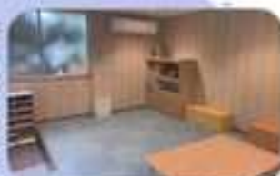
日中一時支援のスペース

実は「きらきら」は元々中華料理屋さんだった建物を少し改修して使っていました。今回リニューアルされましたが、六角形の窓や、ベランダなど随所に中華料理屋さんだった名残があり、とてもユニークです。