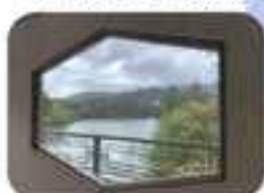
六角形の窓から見える風景

厨房だったところはそのままだっていましたが、今回大きく生まれ変わり、日中一時支援事業の活動スペースとなっています。