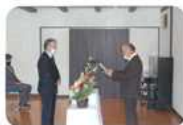
後援会長から寄付の贈呈