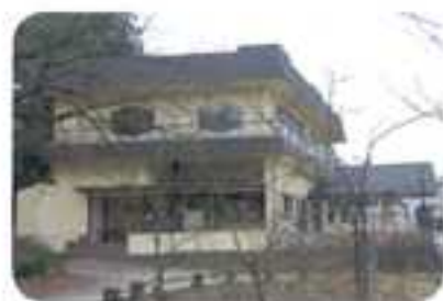
リニューアルした外観

内覧会は、コロナ禍という事もあり、ふくちやま福祉会後援会会長、法人理事、職員など、少人数での開催となりました。後援会様からの寄付の贈呈式も