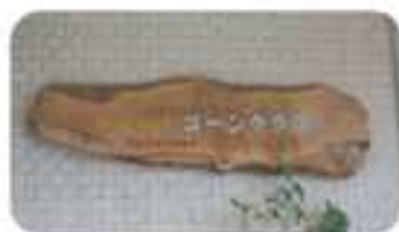
以前から使っていた 番板はそのままに

リニューアルした「きらきら」で、これからどんな楽しいことができるのか、ワクワク、ドキドキ、期待に胸を膨らませていきます。